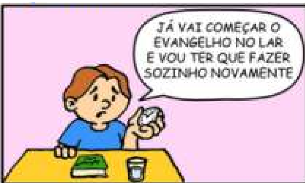
76 - EVANGELHO NO LAR