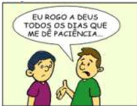
69 - NOSSAS PROVAS