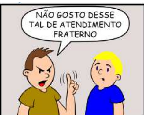
78 - ATENDIMENTO FRATERNAL