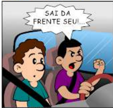
391 - PALESTRA